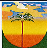
LA PLAINE DES PALMISTES